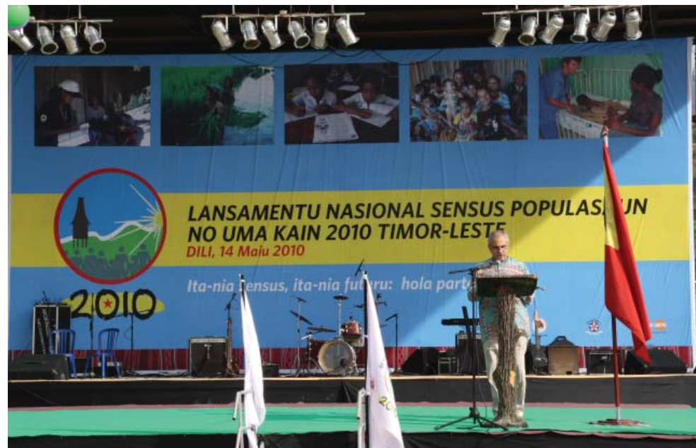
Sua Exelénsia DR. José Ramos Horta – Prezidente RDTL durante lansamentu sensu iha loron, 14 Fulan-Maiu 2010 iha Salaun Konferénsia Internasionál Dili (Eis Merkadu antigu)