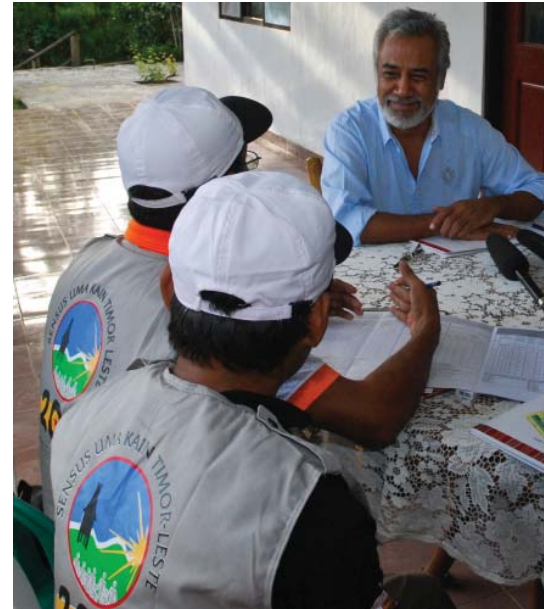
Enumerasaun ba Sua Exelénsia Xanana Gusmão Primeiru Ministru RDTL iha loron, 12 fulan Jullu 2010

Durante enumerasaun, tárjetu populasaun maka ema hotu-hotu ne'ebé toba iha kalan 11/12 fulan-Jullu 2010 iha uma-kain sira, instituisaun sira, ou ema ne'ebé laiha uma hodi hela, iha teritóriu Timor-Leste, no ba sira ne'ebé mak tránzitu iha teritóriu Timor-Leste iha kalan sensu. Maneira ne'ebé halo hodi identifika mak ba kobre populasaun ne'ebé hela iha uma-kain konvensional sira, instituisaun sira, tránzitu nune'e mós ba sira ne'ebé mak laiha uma hodi hela (out-door sleepers). Unidade enumerasaun ba karaterística uma-kain mak unidade uma.