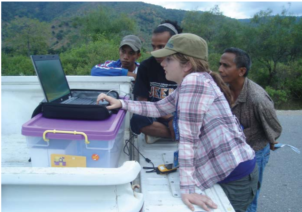
Ekipa Mapeamentu Sensu iha kampu durante hala'o Survei mapeamentu iha Distritu Baucau

vii. Ikus liu, informasaun sensu ne'ebé atu hasai sei ilustra iha mapa temátiku serialmente.